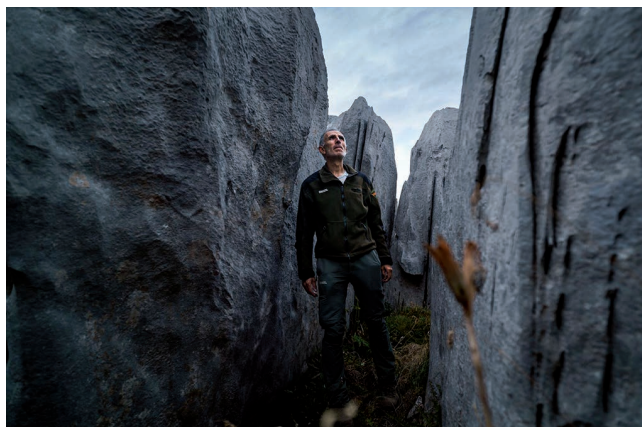
El “laberinto”, enclave único en el macizo de Collarada.

La visión histórica, en este caso de los nombres de los parajes relacionados con los modos de vida de antaño es muy importante; nos sirve para interpretar lo que pasa hoy pero también para saber cómo ha ido cambiando todo. Y yo quizás he llegado ya tarde a recoger el testigo de esa memoria, hemos perdido una generación. Toda esa información la tienes que contrastar con mucha gente, no te puedes fiar solo de una fuente. Y es un proceso de años. Por eso yo tengo la certeza de que hemos llegado tarde. Pese a todo, yo voy a seguir trabajando hasta que me jubile porque me parece que es un tema fundamental y apasionante.