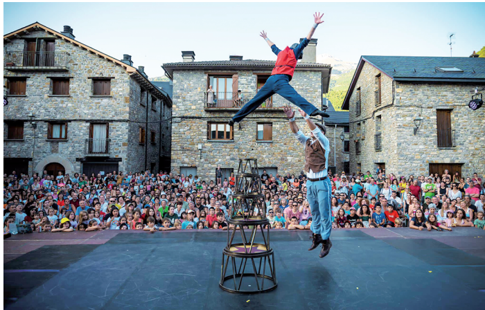
Última edición de Jacetania Circus.

El Ecomarque El Juncaral es el otro gran destino turístico de la localidad. Desde su apertura en 2009 se ha convertido en uno de los referentes turísticos más populares de las comarcas de Jacetania y Alto