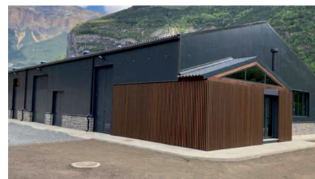
Simulación de la depuradora de Aínsa, similar a la que se construirá en Villanúa.

El Ayuntamiento de Villanúa ha firmado un convenio de colaboración con el Instituto Aragonés del Agua para la construcción de la planta de depuración de aguas residuales. Con la ejecución de este anhelado proyecto, “nuestra localidad estará en condiciones de garantizar un servicio de calidad acorde con las necesidades que se generan tanto en la temporada baja, cuando solo estamos los