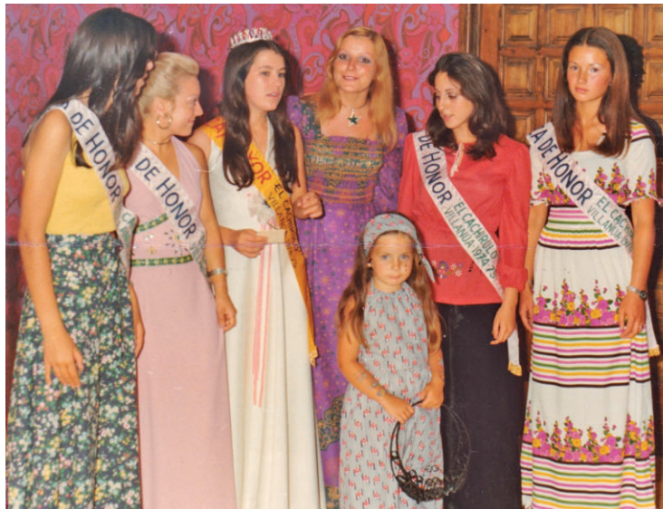
Proclamación de la Reina Moza 1974-75 de la Peña El Cachirulo en Villanúa.

Pero ahora era distinto. En los inicios de la década de los 70 del siglo XX el turismo se estaba democratizando y el franquismo había volcado sus esfuerzos de apertura en el desarrollo estratégico de este sector. El Ministro de Información y Turismo entre 1962 y 1969, Manuel Fraga Iribarne, había dicho en alguna ocasión que los Pirineos eran "la gran reserva turística de Europa". Y a pequeña escala aquellos valles y pueblos, que habían sido desde siempre tierra de agricultores y ganaderos, comenzaron a experimentar el mismo desarrollo urbanístico que vivía el Mediterráneo español. El ICONA (Instituto para la Conservación de la Naturaleza) tiene gran presencia en